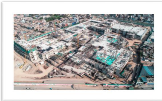
Centro comercial Real Plaza Puruchuco