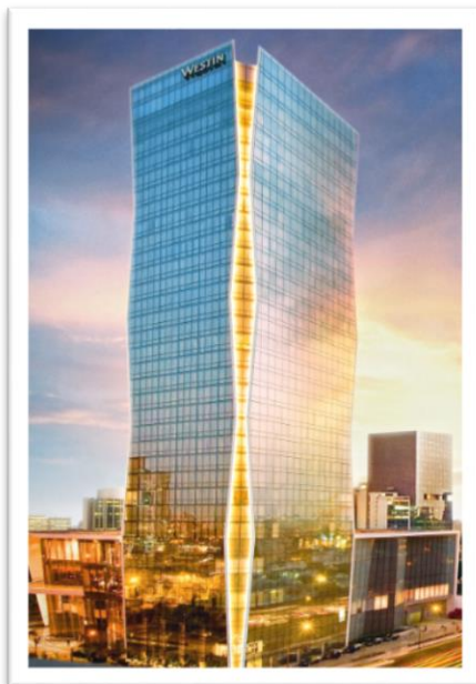
Westin Lima Hotel