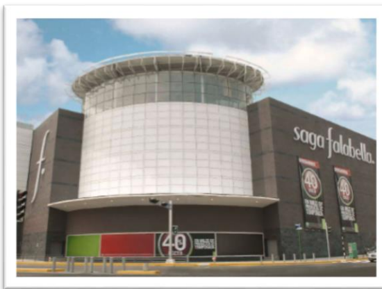
Centro comercial Open Plaza Surquillo